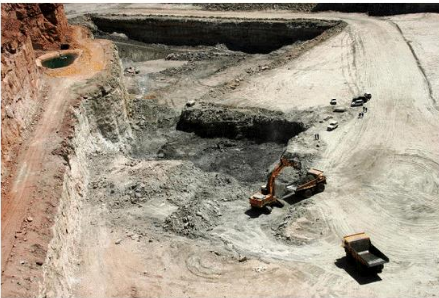
La mine d'Arlit au Niger, ici en 2005, exploitée par le groupe français Orano.

Actuellement, pour faire fonctionner ses 56 réacteurs nucléaires, répartis sur 18 centrales, EDF a besoin de 8 000 à 10 000 tonnes d'uranium naturel en moyenne chaque année. Puisqu'il n'y a plus d'extraction française du minerai, la politique de fourniture d'uranium d'EDF peut se résumer à « ne pas mettre tous les œufs dans le même panier », en cherchant à multiplier les sources d'approvisionnement.